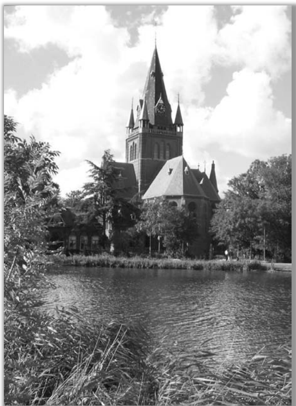
Sint Urbanus, Nes aan de Amstel