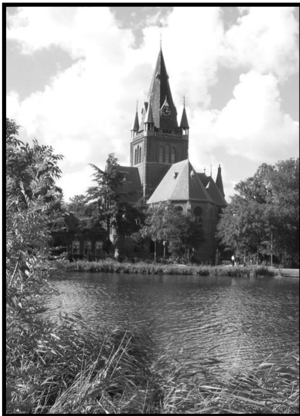
Sint Urbanus, Nes aan de Amstel