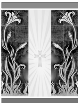
St. Urbanuskerk Nes aan de Amstel

en onderhoud aan de glas-in-lood ramen. Alleen het hekwerk, destijds prachtig geschilderd door Ben houtkamp, zal onaangeroerd blijven. Voorts is er een aannemer geselecteerd die de werken gaat uitvoeren. De volgende stap was de goedkeuring van het project door het kerkbestuur. Tot onze vreugde is deze goedkeuring zeer recent verkregen. De volgende partij die zich er nu over gaat buigen is het bisdom. Mede gezien het gegeven dat dit project in z'n geheel financieel wordt gedragen door stichting 'Vrienden van de Urbanuskerk' ter gelegenheid van de verjaardag van onze kerk, verwachten wij snel een "duimen omhoog" signaal vanuit Haarlem!