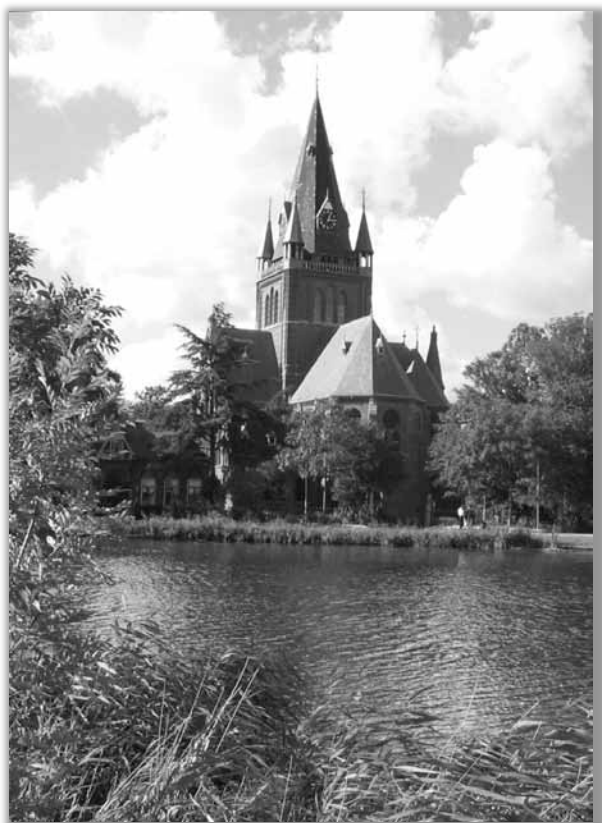
Sint Urbanus, Nes aan de Amstel